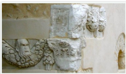
Frises de la chapelle St-Pierre