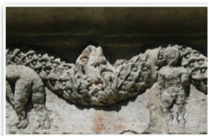
Frise des Antiques St-Rémy de Provence