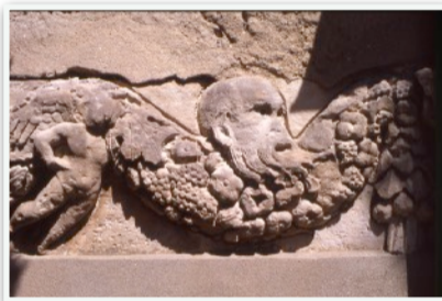
Frise du Beffroi